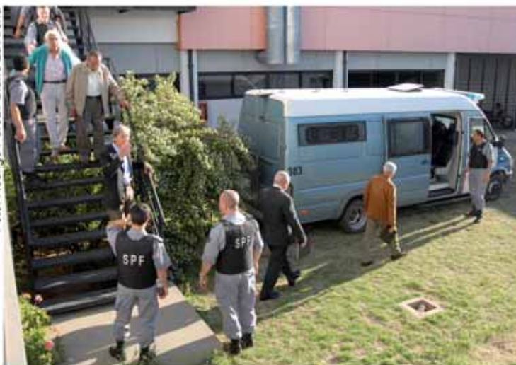
Traslado de los ex represores de la subzona 14 luego de escuchar la sentencia.