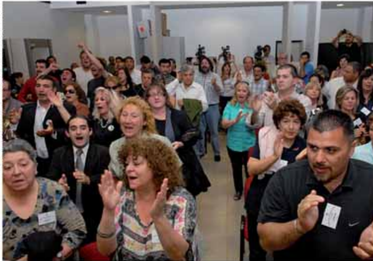
Momento en que el tribunal lee el fallo que condena a los represores.