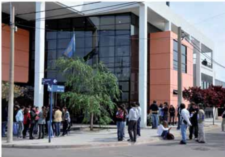
Edificio del Colegio de Abogados, sede del histórico juicio.