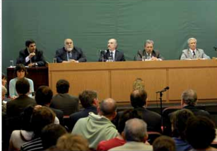
Lectura de la Elevación a Juicio.