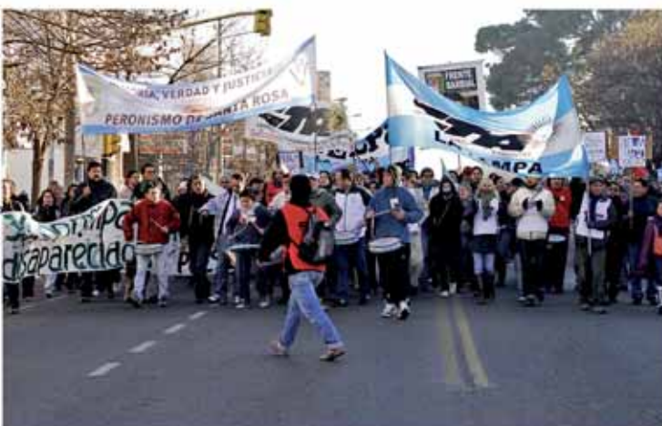
Por iniciativa de la Secretaría de Derechos Humanos de La Pampa, se formó la Multisectorial Memoria – Verdad y Justicia, a la que se sumaron una extensa lista de partidos políticos, centrales de trabajadores, gremios, organizaciones sociales, estudiantiles, y de derechos humanos. En la foto se movilizan a escuchar la Sentencia.