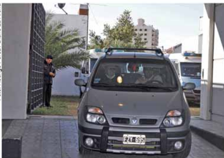
Carlos Aragonés se retira del Colegio de Abogados luego de declarar en el juicio a los responsables de la Subzona 14.