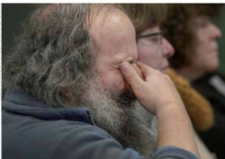
Los recuerdos que despertaban los testimonios, conmovían a muchas personas que asistían a presenciar las audiencias.