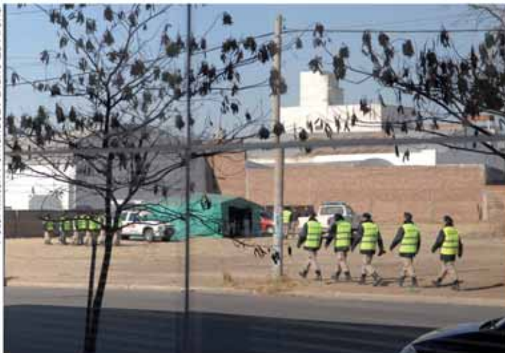
La Policía de La Pampa realizó la custodia del Juicio.