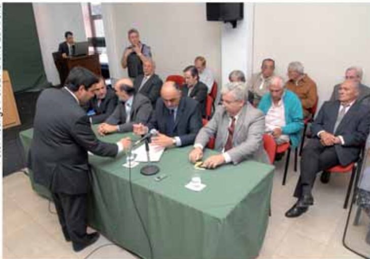
Los abogados defensores firman la sentencia del juicio por la subzona 14.