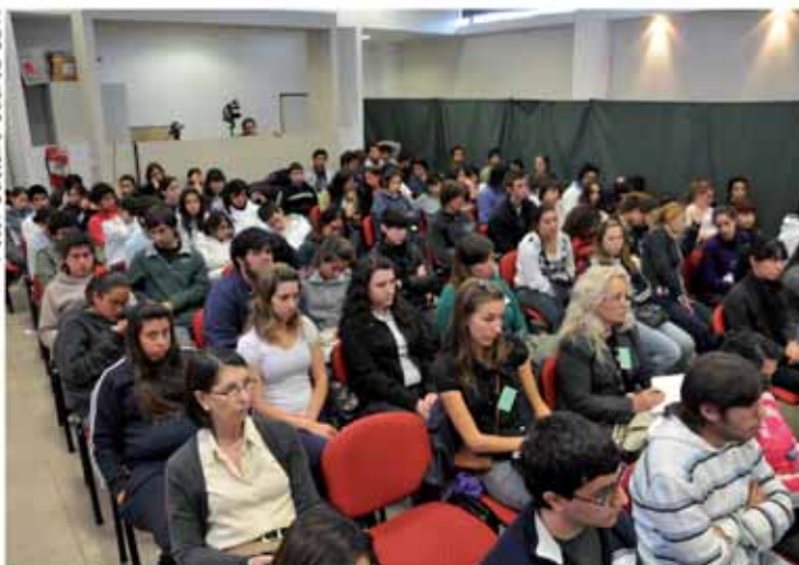
El público asiste al histórico Juicio.