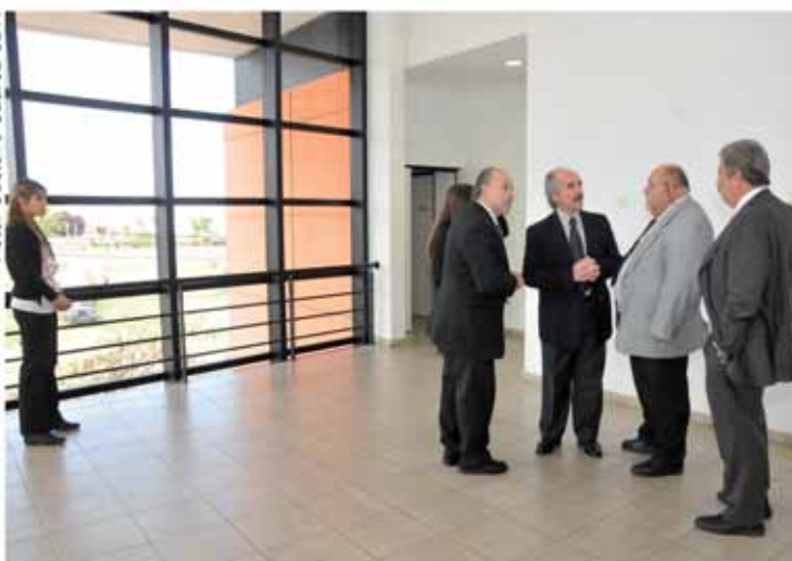
En un intervalo los jueces dialogan.