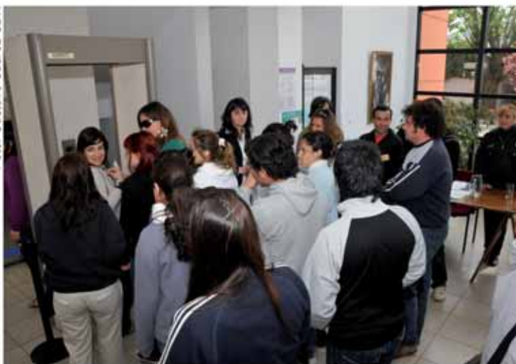
Estudiantes Secundarios asisten a una jornada del juicio.