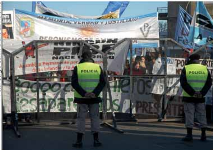
Movilización de gremios, partidos políticos y organizaciones sociales en apoyo al comienzo del juicio a los integrantes de la Suzona 14.