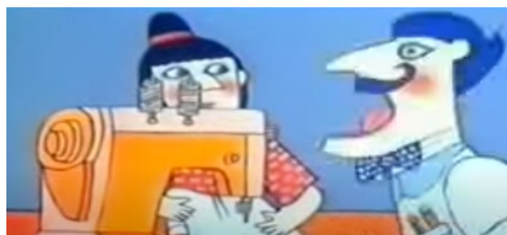
Su jefe la reta por tener una producción “lenta”