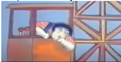
(Hombre en el trabajo, construcción)