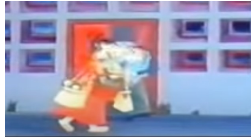
La mujer realiza las compras de la casa y busca a los hijos