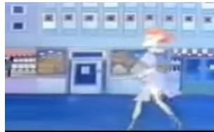
(Silva a una mujer que pasa)