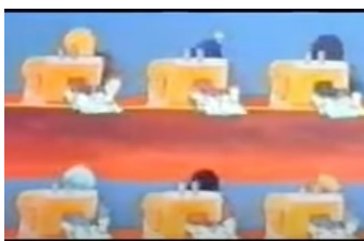
(Mujer en el trabajo, taller textil)