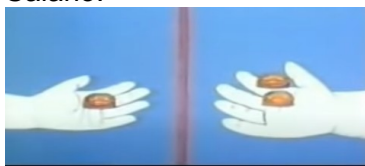
(Izq. Mujer – Der. Hombre)