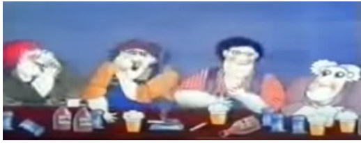
El hombre sale a tomar algo con sus amigos