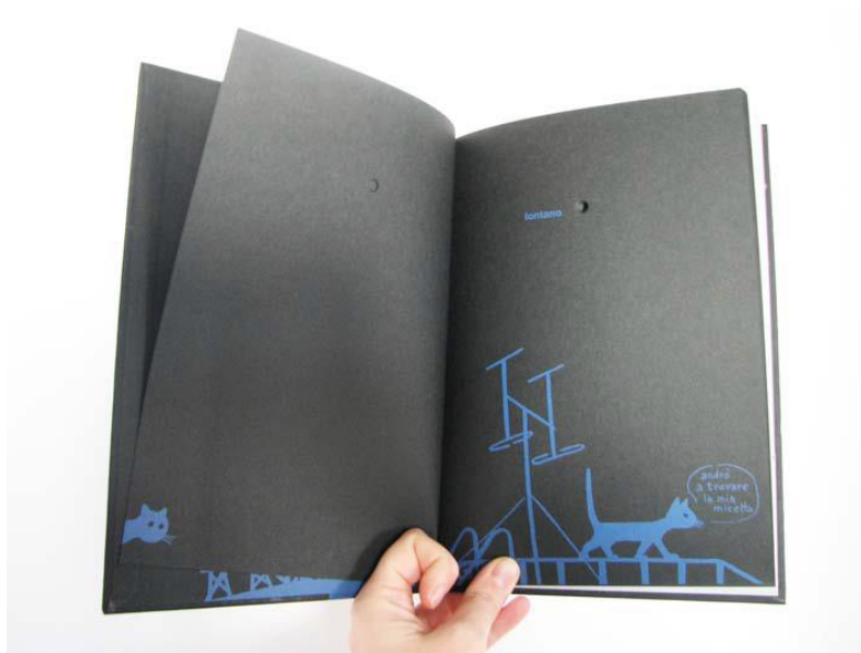
Figura 2. Interior del libro El Principito. Fuente: Istvan. Libro-objeto (2010:42)