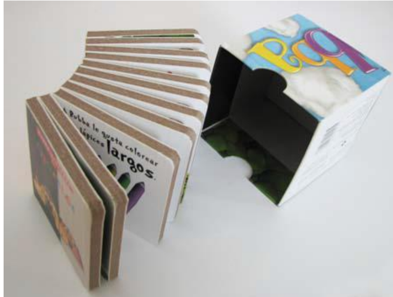
Figura 4: Interior del libro Popville. Fuente: Istvan. Libro-objeto (2010:75)