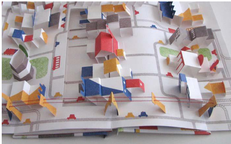
Figura 5: Doble página interna del libro-objeto. Páginas troqueladas.